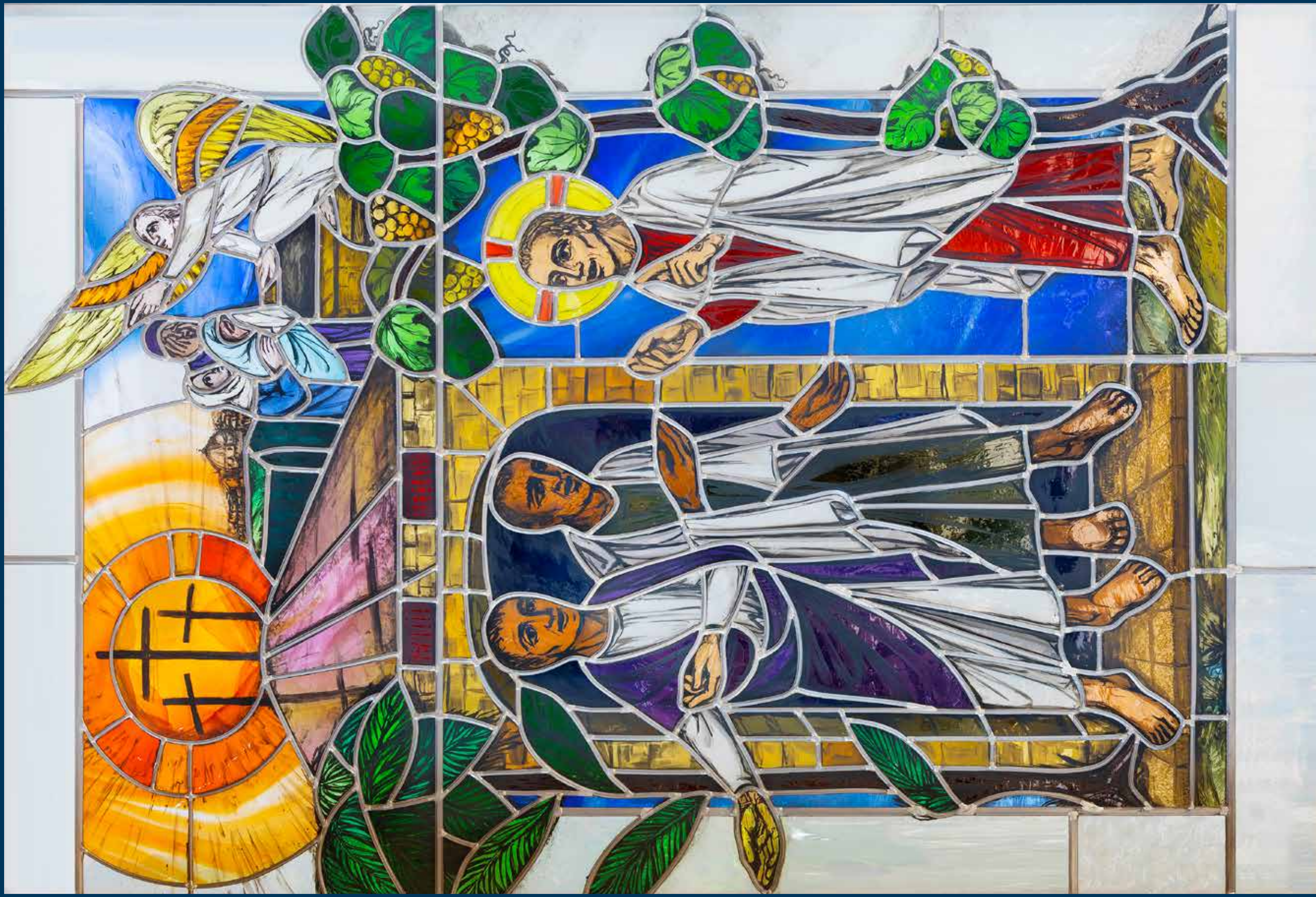
Jesus begleitet die Emmaus-Jünger auf ihrem Weg. Glasfenster von Anne-Dore Kunz-Saile, Emmauskapelle der Diakonie Stetten in Kernen-Stetten.