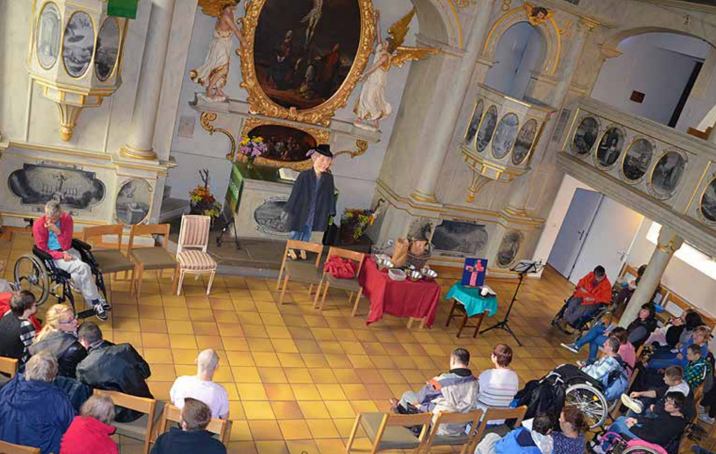
Andacht des Förder- und Betreuungsbereiches der Remstal Werkstätten in der Schlosskapelle in Kernen Stetten.

Titelthema Andachten und Gottesdienste ganzheitlich gestalten