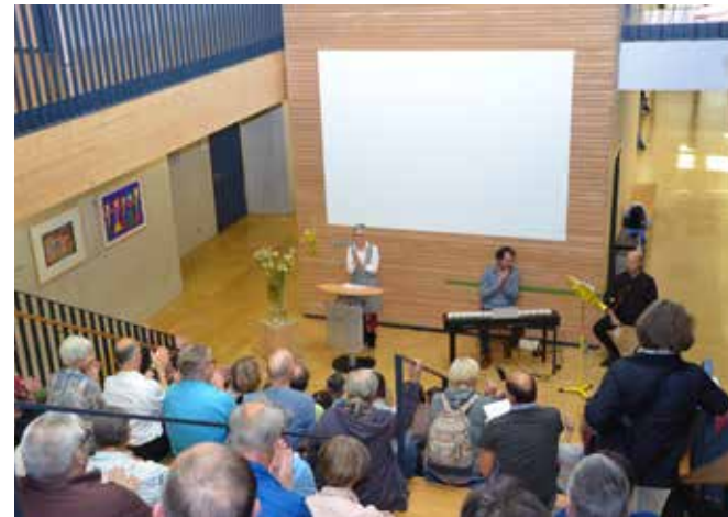
Eröffnung einer ausdrucksstarken Ausstellung der Kreativen Werkstatt.