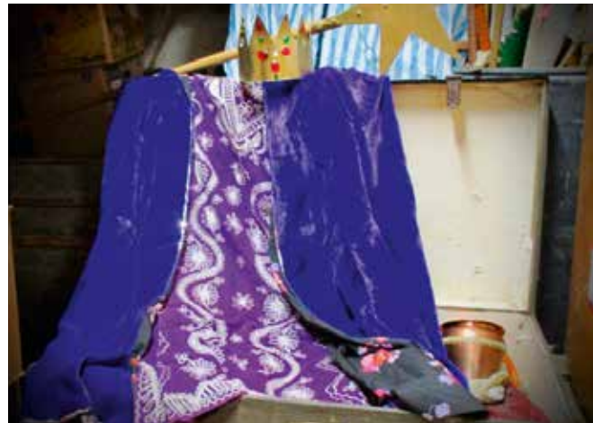
Jedes Krippenspiel benötigt eine passende Ausstattung.